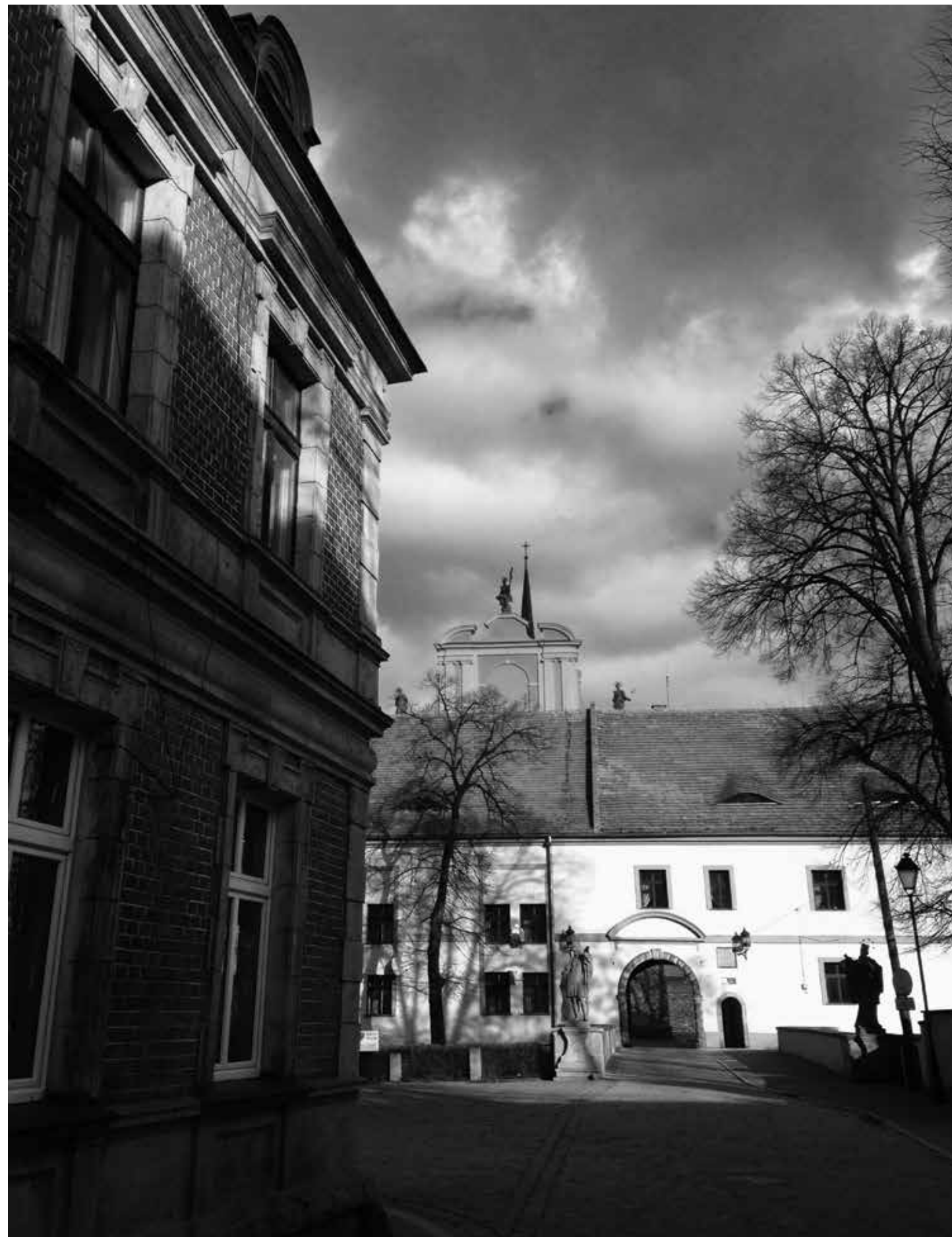
Ulica Kamińska Ząbkowickiego