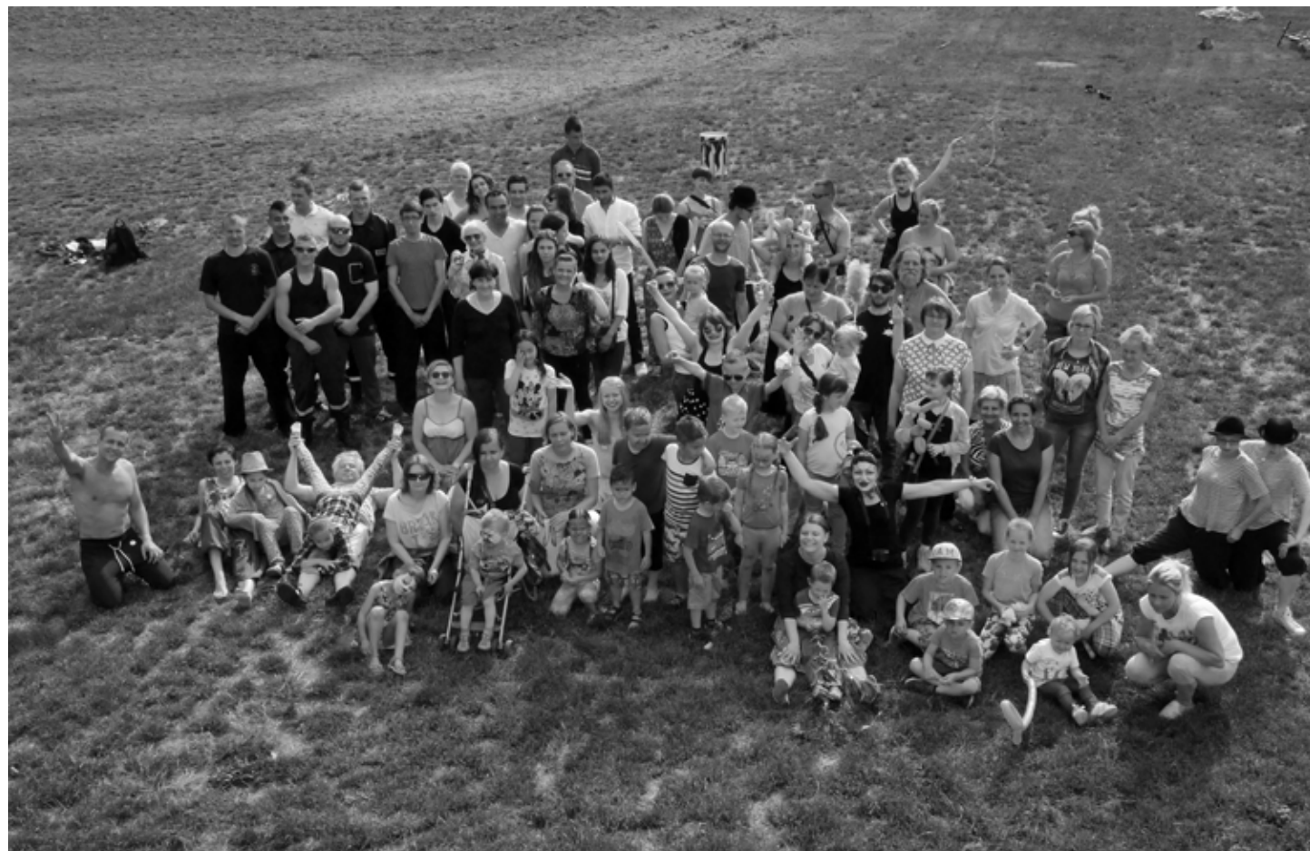
Ata i mieszkańcy Kamięcia Ząbkowickiego