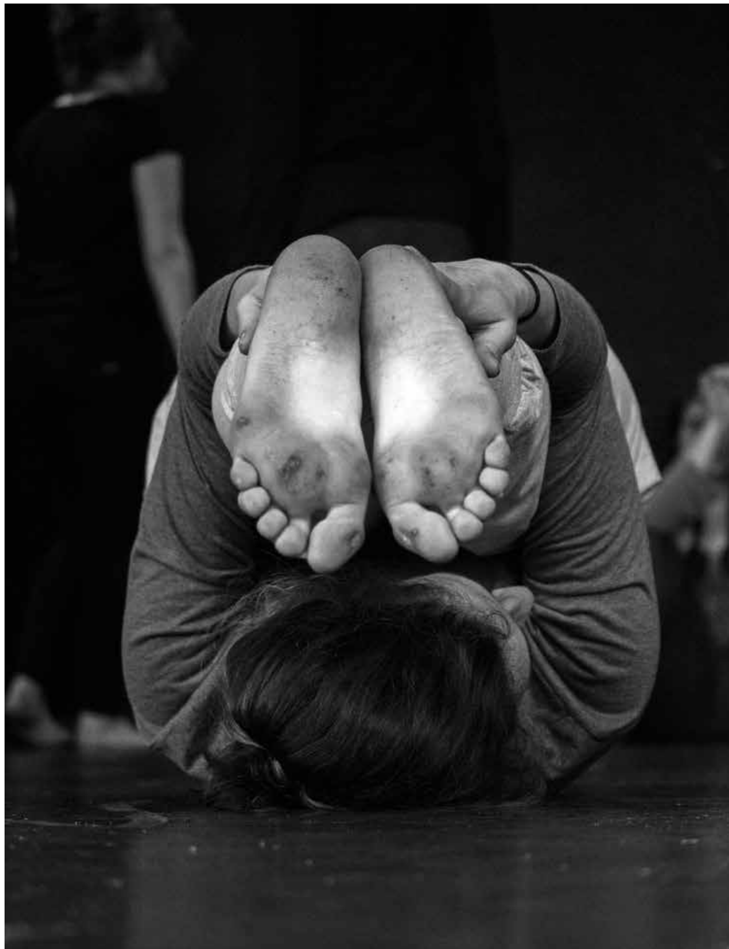
Warsztaty Akademii Teatru Alternatywnego