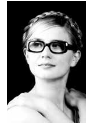
— dyrektor festiwalu — dyrektor festiwalu